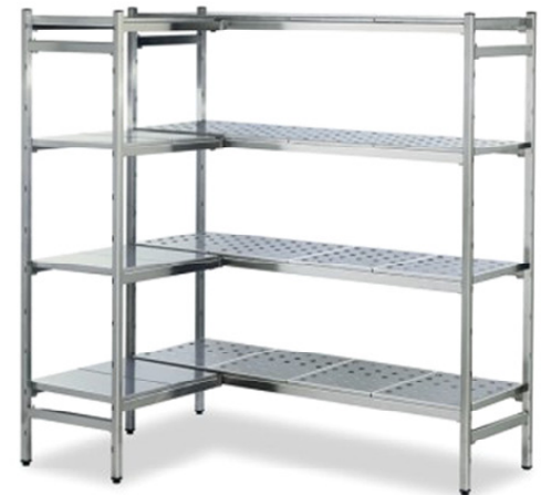
Detalle de bandeja estanterías